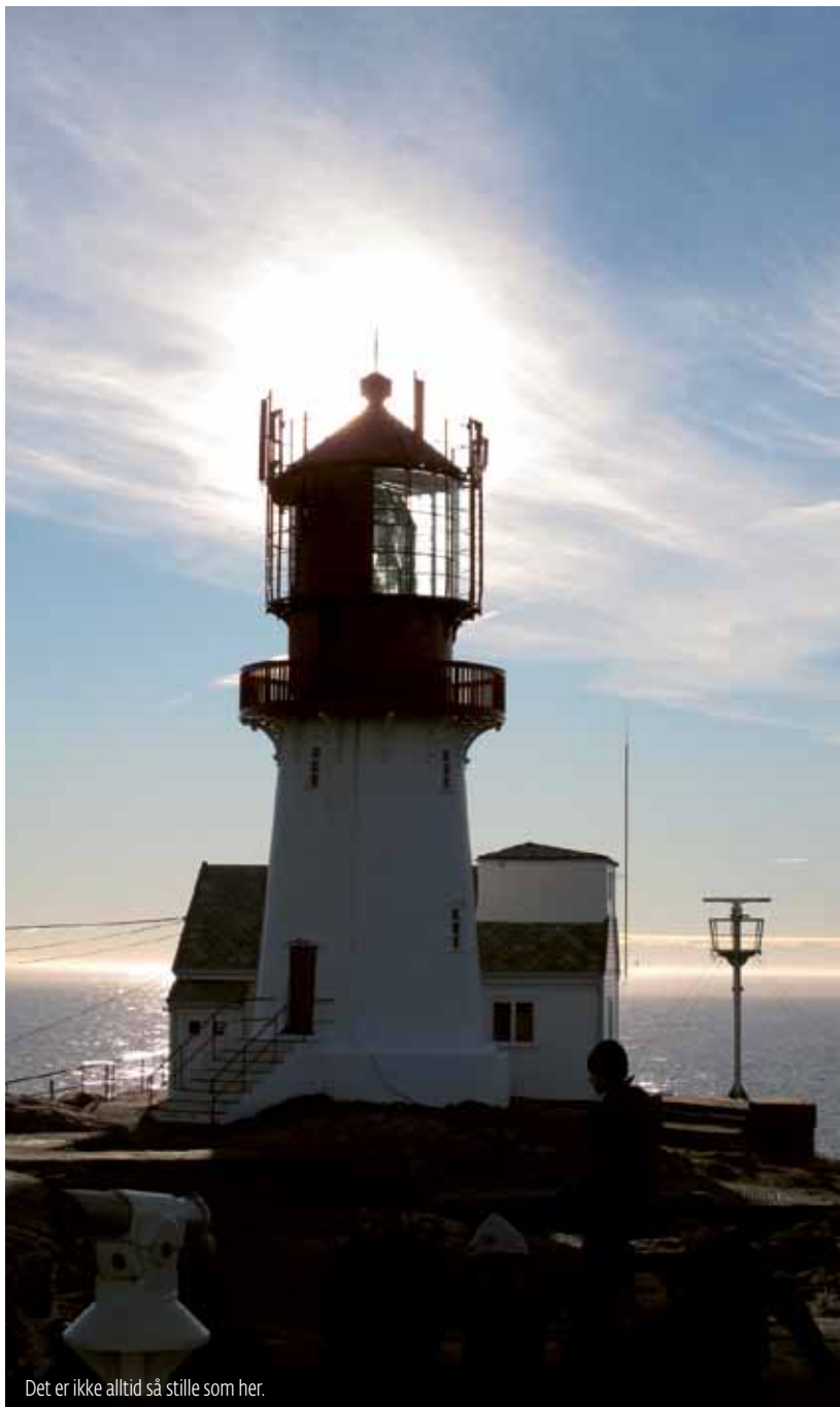
Det er ikke alltid så stille som her.

For navigatøren er det helt avgjørende å holde seg oppdatert gjennom å vedlikeholde aktuelle nautiske publika-