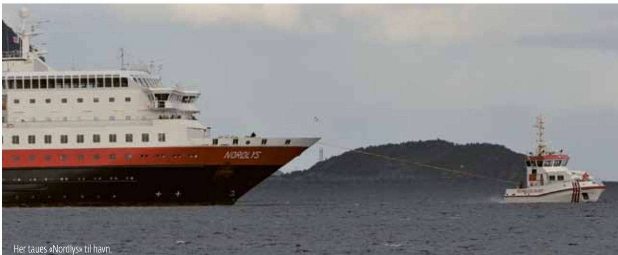
Her taues «Nordlys» til havn.