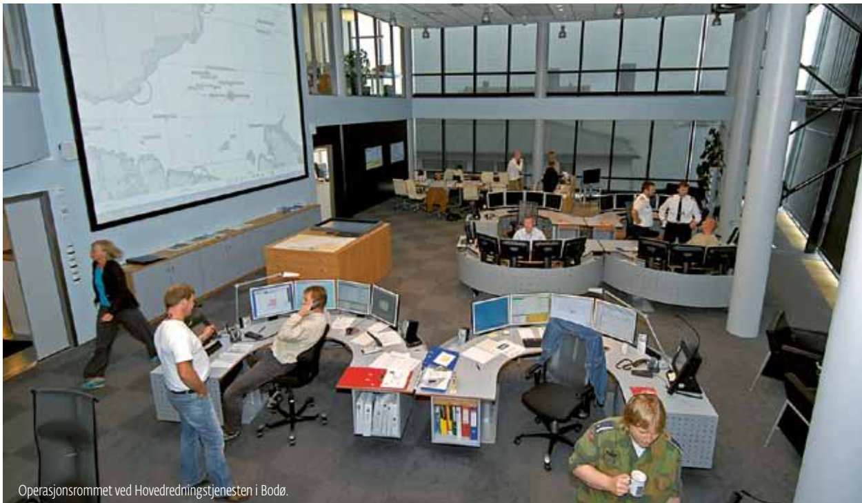
Operasjonsrommet ved Hovedredningstjenesten i Bodø.