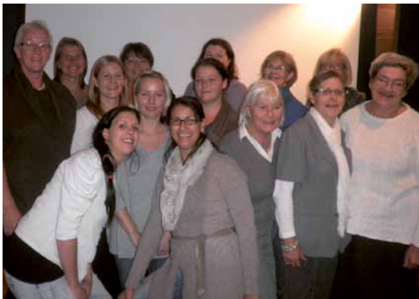
Fornøyde kursdeltakere i Stavanger.

Medio oktober ble det arrangert kurs i «Psykisk førstehjelp» i Oppland, nærmere bestemt på Brandbu. Kurset ble arrangert av KFB Oppland i samarbeid med Oppland Bygdekvinnelag. 17 personer deltok.