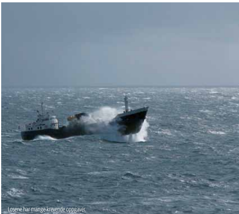
Losene har mange krevende oppgaver.

I Norge er alle losere utdannet som sjøkapteiner eller de har tilsvarende utdanning fra Sjøforsvaret. Inngående kunnskap om lokale forhold er den beste beredskap rederiene kan ha.