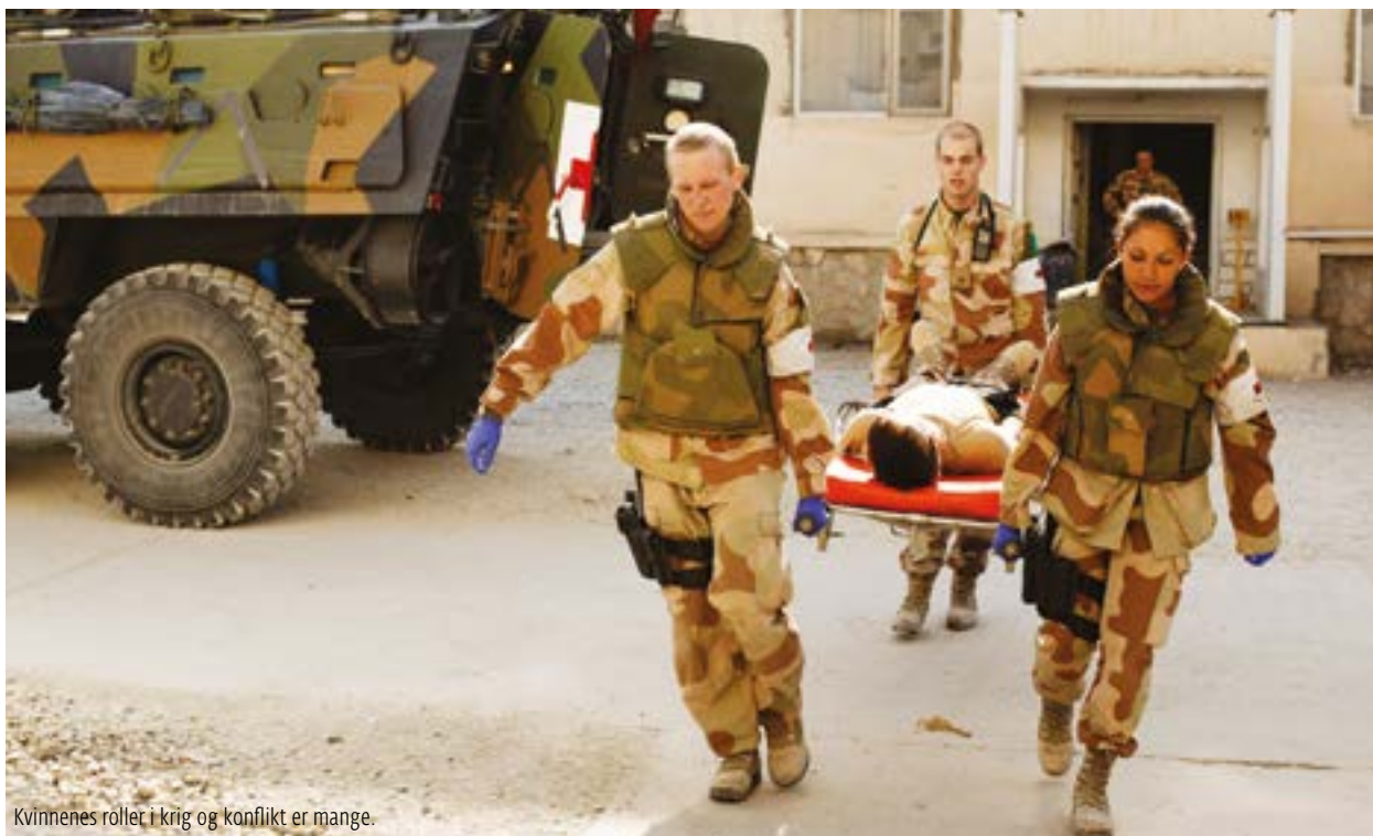
Kvinnenes roller i krig og konflikt er mange.