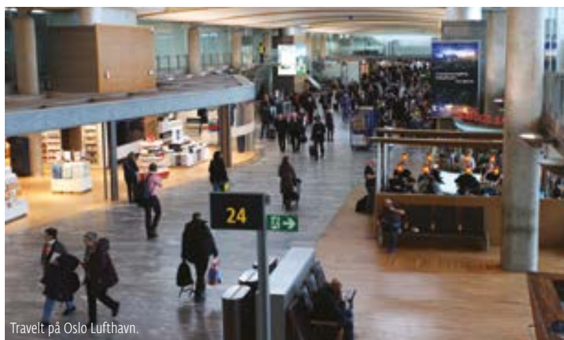
Travelt på Oslo Lufthavn.

Han ser for seg et scenario der hele Østlandet er mørklagt.