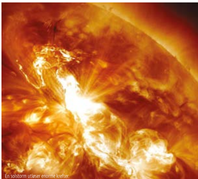
En solstorm utløser enorme krefter.

Direktoratet for Samfunnssikkerhet og beredskap (DSB), Statnett og NVE har vurdert Norges sårbarhet overfor den elektromagnetiske strålingen og konkludert med at landet, tross alt, er temmelig robust. Norge har et lite strømmenn med mange kraftverk og korte avstander. Landet vil aldri få en fullstendig kollaps av den størrelsesorden Det amerikanske forskningsrådet beskriver.