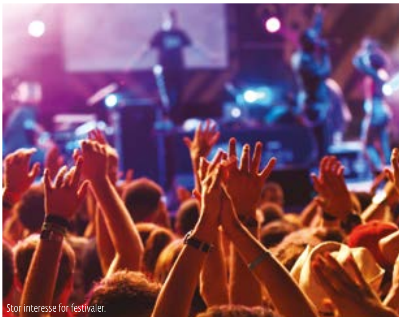
Stor interesse for festivaler.

– Erfaringen viser at det under store arrangementer vil inntreffe hendelser der det er fare for at liv kan gå tapt. Gjennom årenes løp har jeg sett mange eksempler på folk som brått har fått et illebefinnende og falt om. Noen har faktisk dødd, rett og slett fordi det tok for lang tid for helsepersonellet å komme til stedet. Ved slike akutte hendelser er en avhengig av at noen i nærheten kan livreddende førstehjelp. Derfor bør alle festivalarrangører sørge for at det er personer med den nødvendige kunnskap blant publikum, som kan trå til i påvente av at innleid