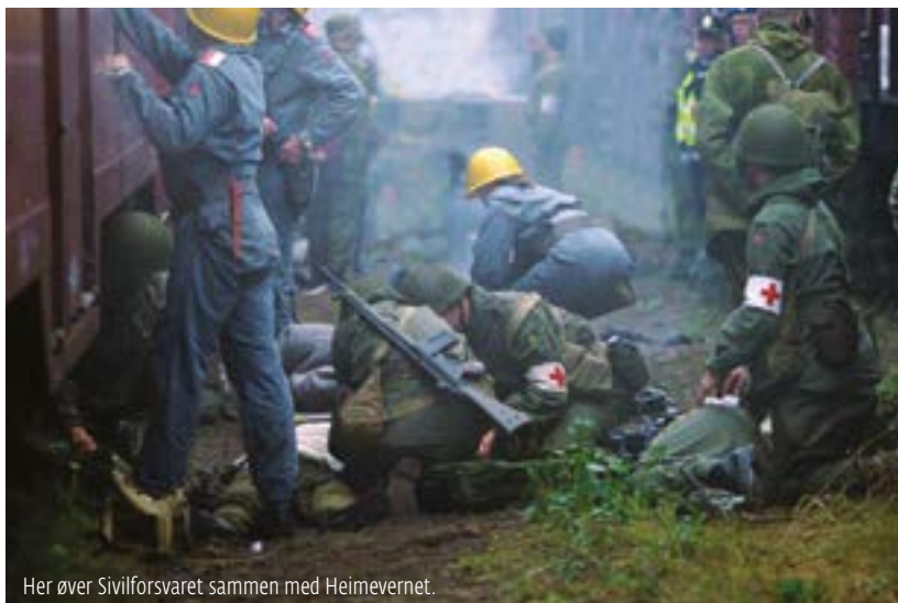
Her øver Sivilforsvaret sammen med Heimevernet.