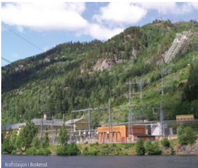
Kraftstasjon i Buskerud.