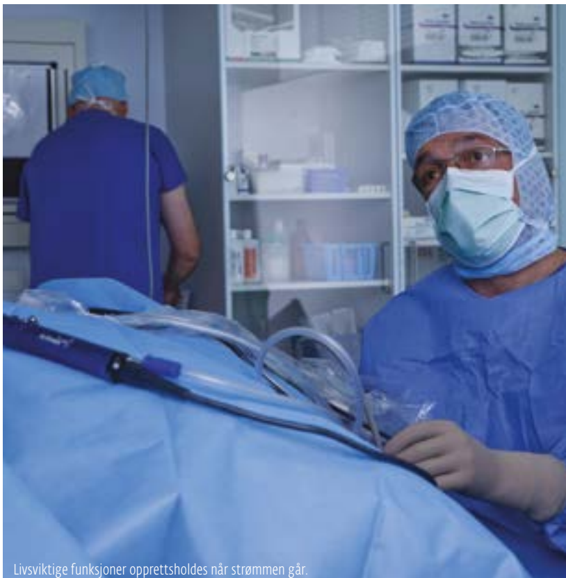
Livsviktige funksjoner opprettholdes når strømmen går.

– Ved brudd i kraftforsyningen fra eksternt leverandør, det vi benevner som normal kraft, kan vi opprettholde kraft i bygg eller rom som har nødstrøm fra aggregater. Ventilasjon, kompressorer for medisinske gasser og en del annet kritisk utstyr