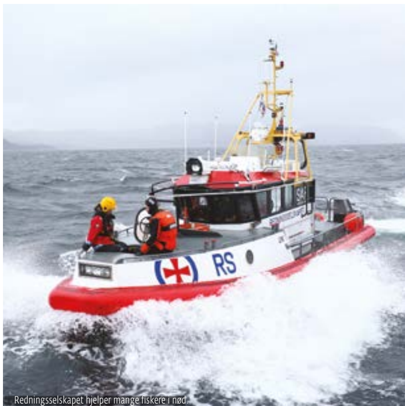
Redningsselskapet hjelper mange fiskere i nød.