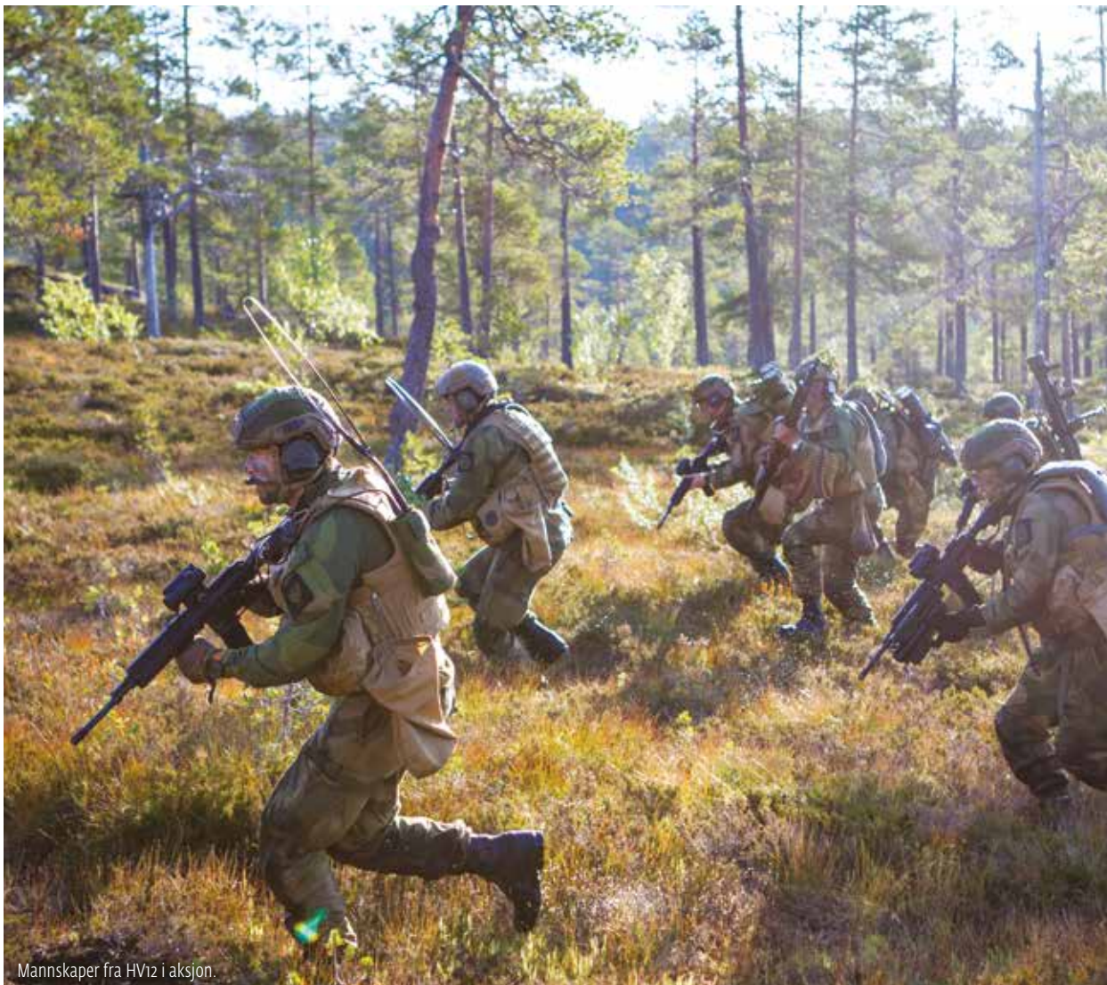
Mannskaper fra HV12 i aksjon.