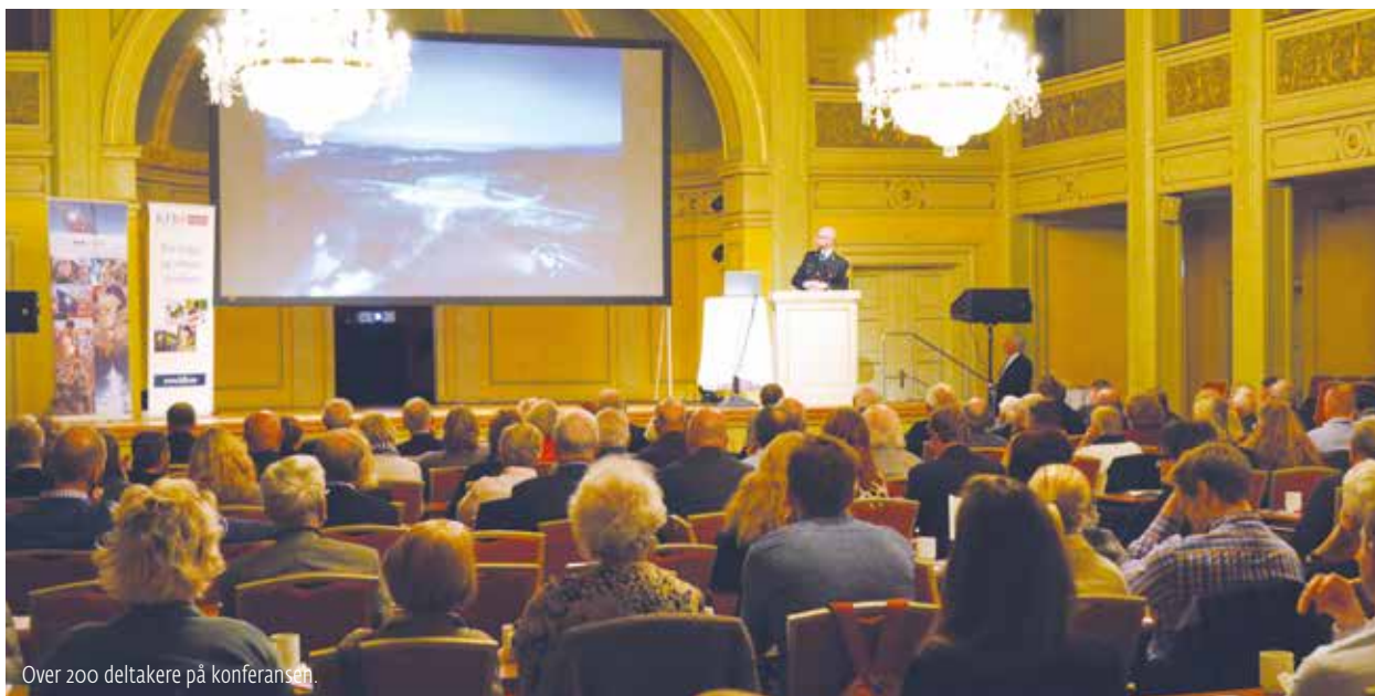
Over 200 deltakere på konferansen.