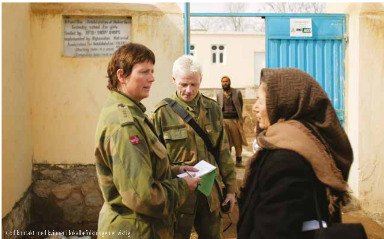
God kontakt med kvinner i lokalbefolkningen er viktig.