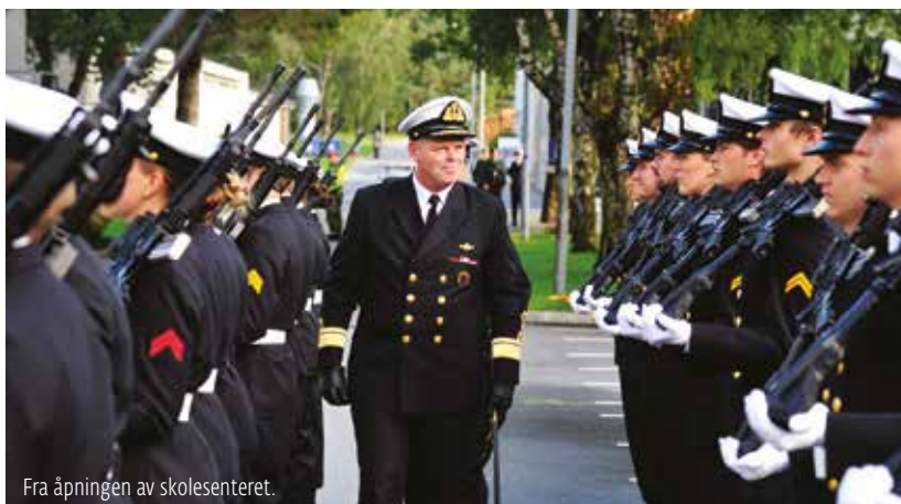
Fra åpningen av skolesenteret.

De nye og ombygde vognene vil dessuten gi økt beskyttelse for mannskapene som opererer dem. Nye kapasiteter vil bl.a. være økt mine- og ballistisk beskyttelse, i form av fjernstyrt våpenstasjon og gummibelter for økt fremkommelighet. Dette gir en betydelig bedre beskyttelse for personellet mot veibomber og miner. Samtidig gir det økt kapasitet når det gjelder observasjon og siktemidler, slik at en er i stand til å bekjempe en motstander raskere.