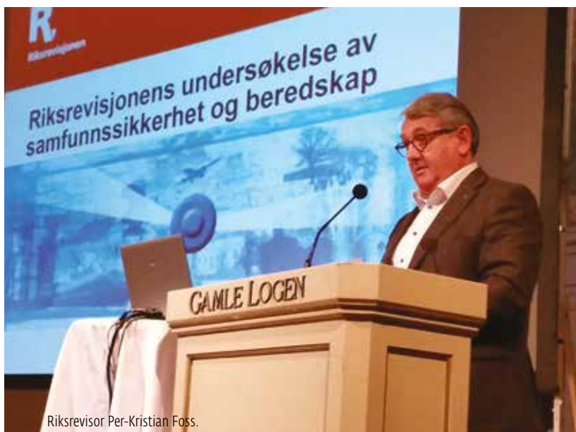
Riksrevisor Per-Kristian Foss.